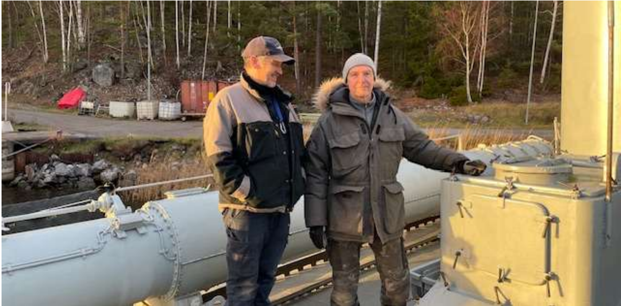
Två ur besättningen utbyter tankar och idéer om läcktätning.

I och med passagerarkörningen den 4 oktober var årets verksamhet till sjöss (gångdagar) över. Nu väntade utvärdering av årets verksamhet, planering av verksamheten 2026 och de underhållsåtgärder som inte hunnits med eller som är planlagd till vinterhalvåret. Vi kommer också att intensifiera vårt självkontrollarbete av sjösäkerheten ombord.