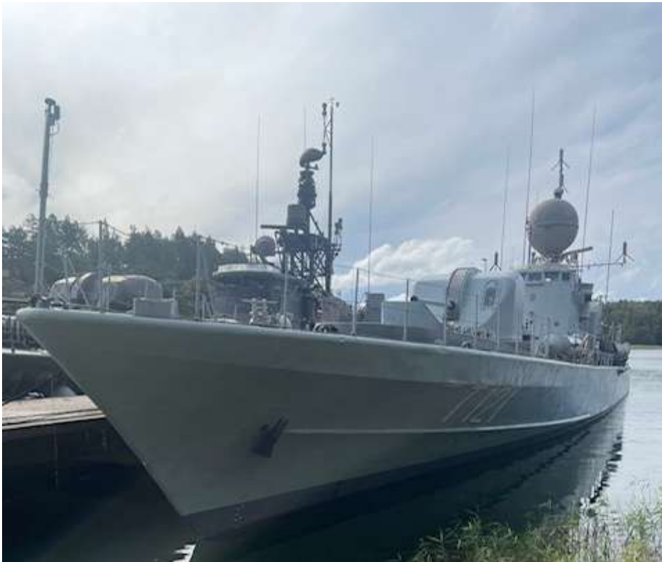
Här ovan ligger de båda "tunga enheterna" sida vid sida ute på Gålöbasen.

Som de flesta vet har R142 Ystad varit inblandad i en incident med Waxholmsbåten Silverpilen. Efterspelet med dom i Tingsrätten och ny dom efter överklagande är nu klart och detta har inneburit att R142 Ystad har fått stärka sin passagerarsäkerhet ombord, något som med största säkerhet även kommer att behövas hos oss. Vi tar nu höjd för detta och kommer att skärpa upp säkerhetsarbetet under våren, mer om detta i rederiets del av brevet.